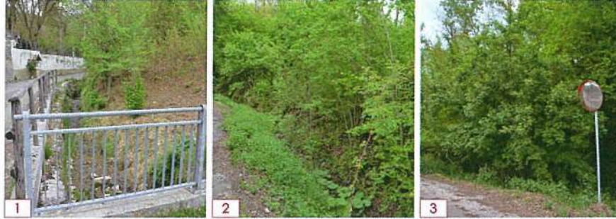
NOTA: Il tratto ha una lunghezza di 2,11km e parte da un'altitudine di circa 924 m s.l.m. fino ad arrivare a quota 833 m s.l.m.

Le riprese fotografiche vanno corredate da brevi note esplicative e dall'individuazione del contesto paesaggistico e dell'area di intervento;