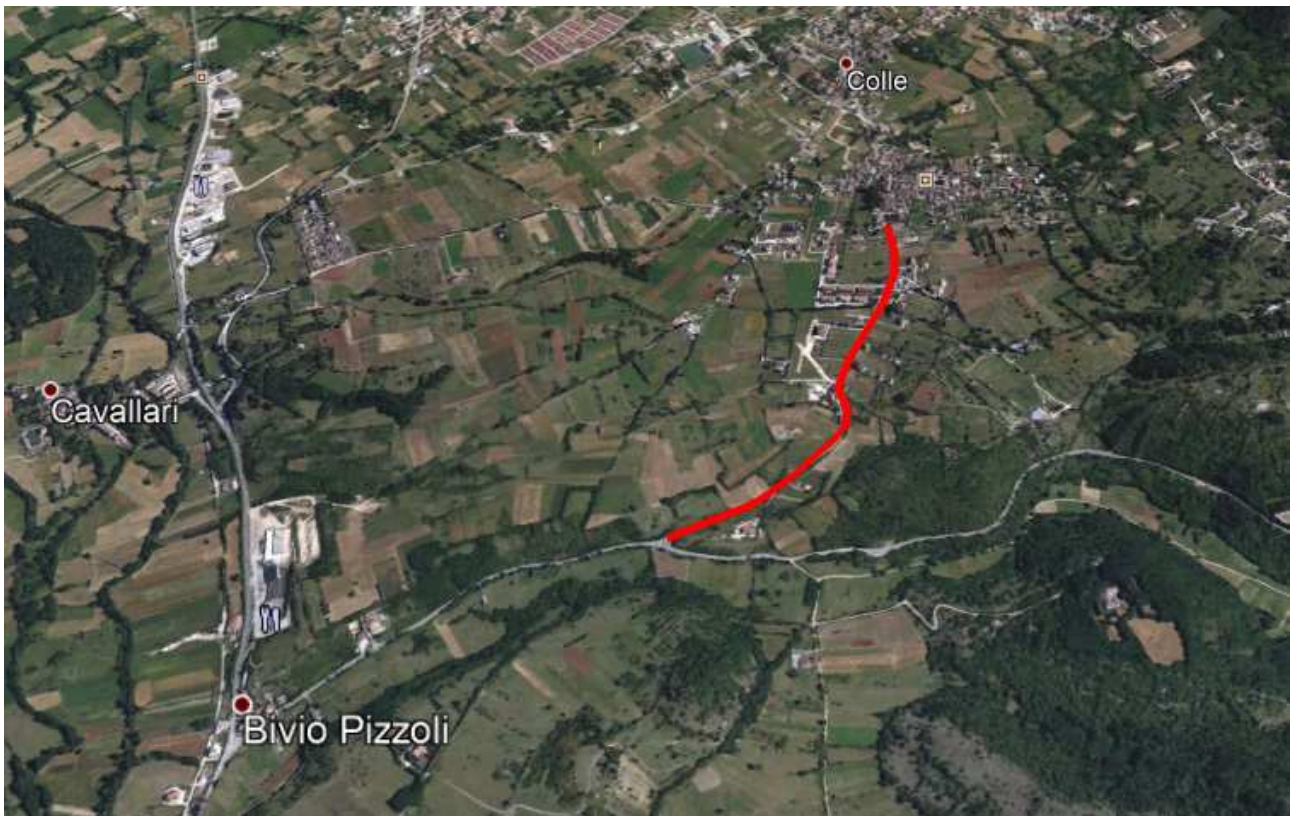
Vista Satellitare S.P. 29 "DELL'ALTO ATERNO" Tratto interessato dagli interventi