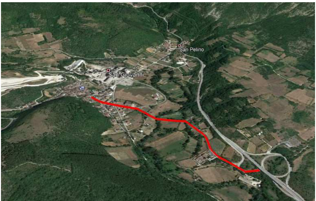
Vista Satellitare S.P. 30 DIR "DI CASCINA" Tratto interessato dagli interventi