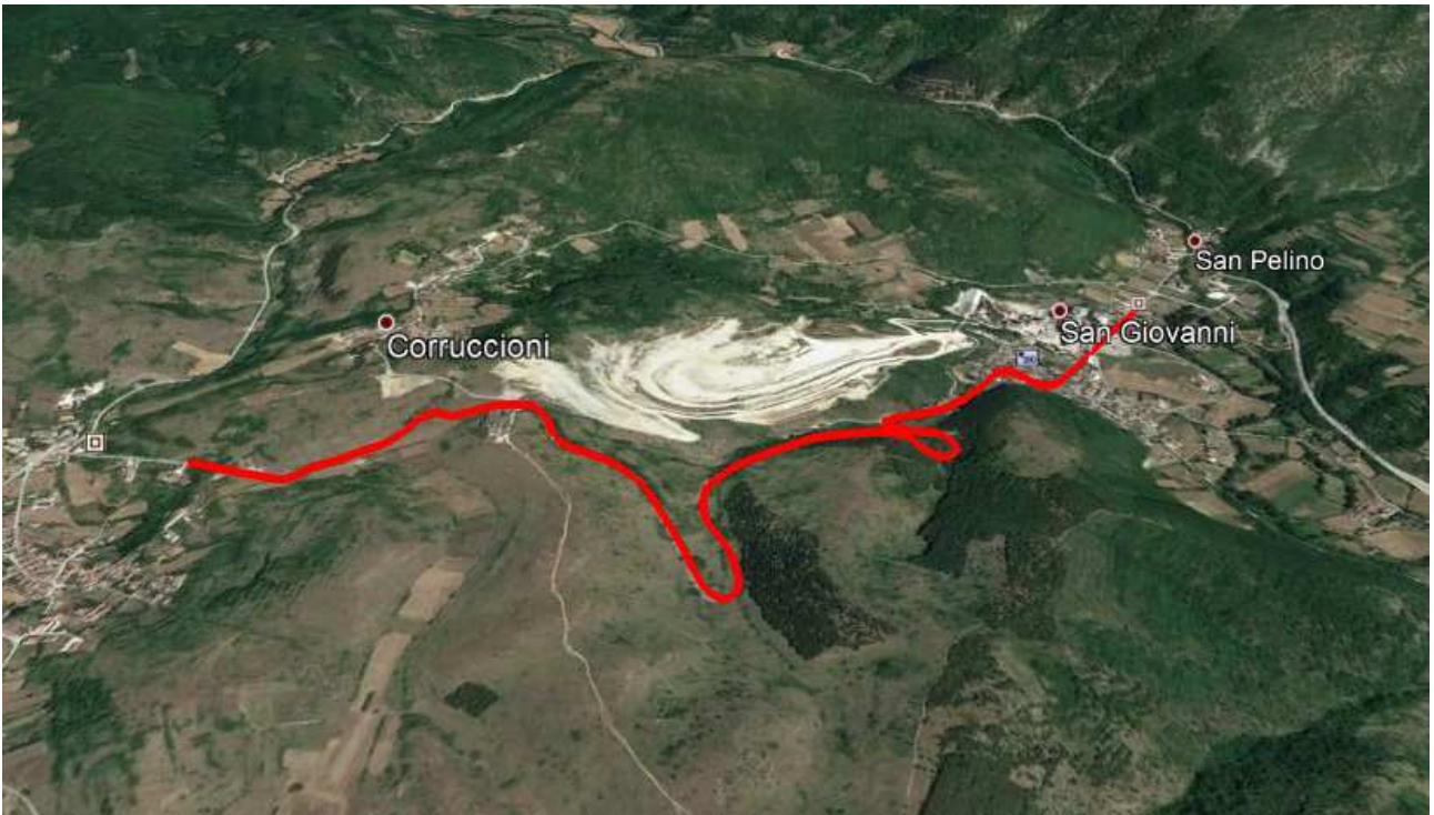
Vista Satellitare S.P. 30 "DI CASCINA" Tratto interessato dagli interventi