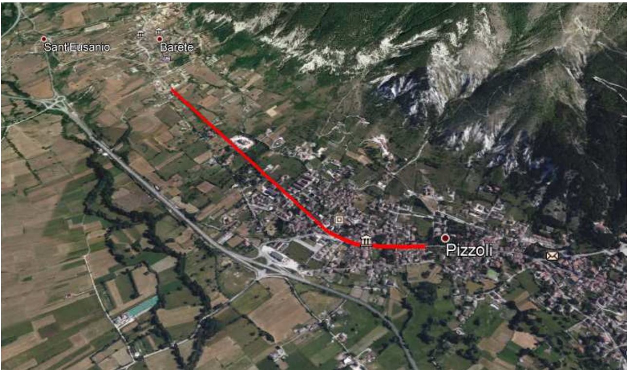
Vista Satellitare S.R. 260 "PICENTE" Tratto interessato dagli interventi